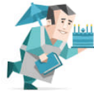
CONSUL ESFJ (-A/-T)